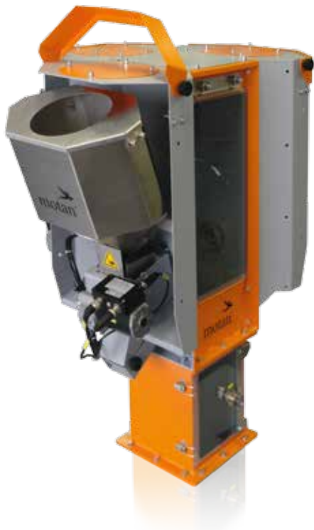
Système rapide de changement