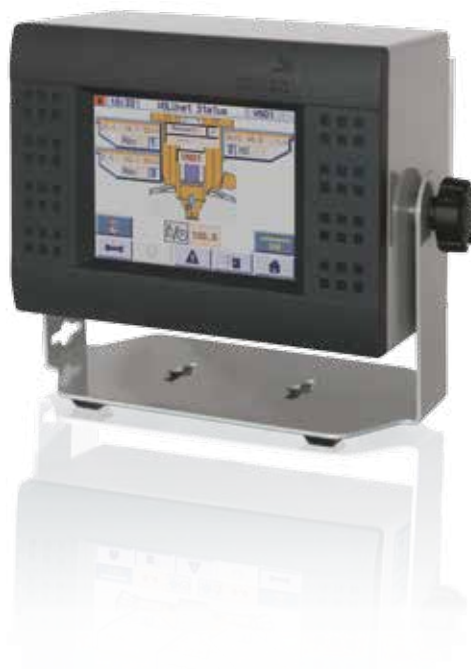
P205 avec VOLUnet SC

Le système unique de mélange par gravité par motan permet un mélange très homogène des composants, avant leur introduction dans l'extrudeuse. Cette fonction joue un rôle essentiel pour homogénéiser et plastifier parfaitement des matières.