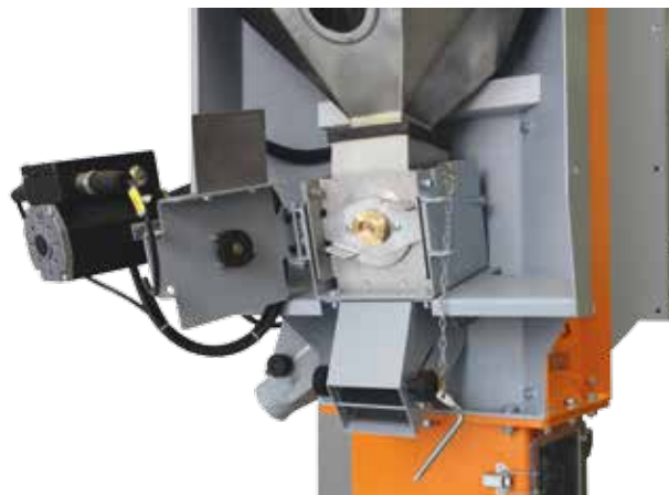
Vis de dosage montée sur roulement unilatéral, équipée d'un raccord à démontage rapide.